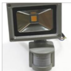
FLOOD LIGHT COB AVEC DETECTEUR 50 W