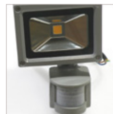
FLOOD LIGHT COB AVEC DETECTEUR 80 W