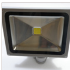
FLOOD LIGHT COB AVEC DETECTEUR 30 W