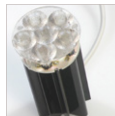
SPOT A LEDs MR16 SIXTO LEDs 500 mA