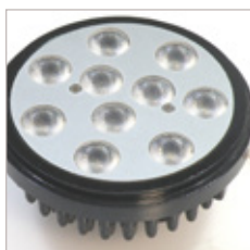
SPOT U111 10 LEDs