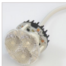
SPOT A LEDS TRIO MR16 LEDS SLIM 350 mA