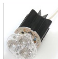
SPOT A LED MR16 500 mA