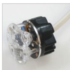
SPOT A LEDS TRIO MR11 LEDS