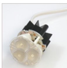
SPOT A LEDS TRIO MR16 350 mA