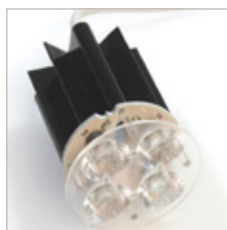
MR16 QUATRO LEDS 500 mA