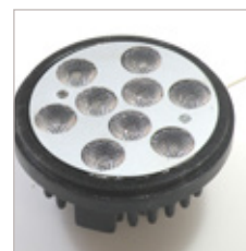
SPOT U111 9 LEDS