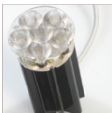
MR16 SIXTO LEDS 350 mA