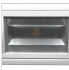
ENCASTRE DE PLAFOND 30 W D'INTERIEUR AFINO