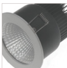
ENCASTRE DE PLAFOND 15 W D'INTERIEUR ENTIO