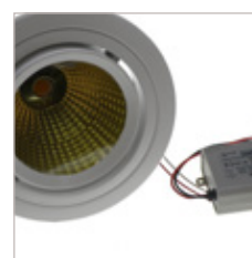
ENCASTRE DE PLAFOND 30 W D'INTERIEUR PATIO