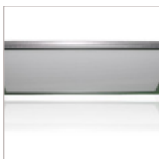
DALLE LUMINEUSE 295 X 595 26 W