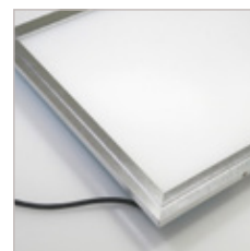
DALLE LUMINEUSE 295 X 295 36 W