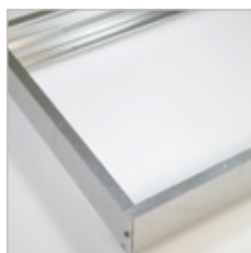
CADRE DE DALLE LUMINEUSE