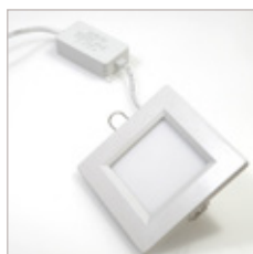
DALLE LUMINEUSE 110 x 110 6 W