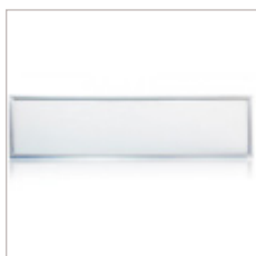
DALLE LUMINEUSE 295 x 1195 42 W