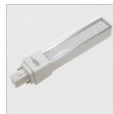
AMPOULE G24D 10 W