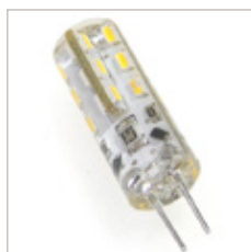
AMPOULE G4 1.5 W 12 V DC