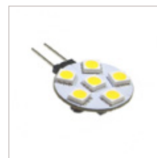
AMPOULE G4 RONDE 1.5 W AC/DC