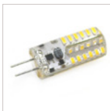
AMPOULE G4 2.5 W AC/DC