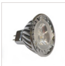
AMPOULE MR16 LEDS 3 X 1 W GX5.3 12 V AC/DC