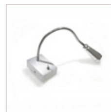
LISEUSE 1 W 100LM SUPPORT CARRE