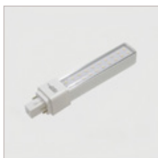
AMPOULE G24-Q 6 ET 10 W