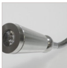
LISEUSE 1 W 100LM SUPPORT ROND