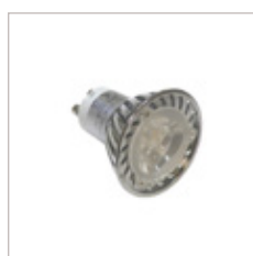
AMPOULE MR16 LEDS 3 X 1 W 220 V GU10